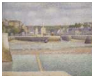
Georges Seurat, Port-en-Bessin , 1888, huile sur toile, Saint Louis Art Museum

Conservateur honoraire du patrimoine, musée de Douai