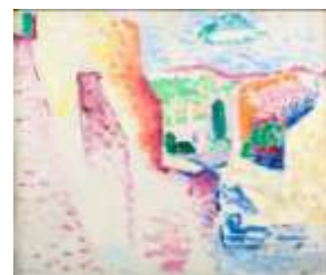
Henri Matisse, Collioure, rue du Soleil , été 1905, huile sur toile, musée départemental Matisse, Le Cateau-Cambrésis

Cette exposition est organisée en partenariat avec le musée départemental Matisse du Cateau-Cambrésis (Nord).