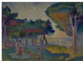
Henri Edmond Cross, Bords méditerranéés , 1895, huile sur toile, coll. part.