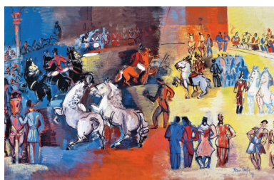
Jean Dufy, Le Cirque, 1927 - Huile sur toile 45x75cm - Collection privée - ©Adagp, Paris 2011

Regroupant une centaine de peintures, d'aquarelles et de céramiques provenant de musées et de collections particulières du monde entier, l'exposition cherche à mettre en évidence les liens qui unissent l'œuvre de Jean à celle de Raoul comme ce qui les singularise l'une de l'autre.