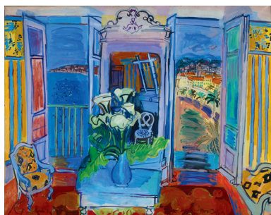
Raoul Dufy, Intérieur à la fenêtre ouverte, 1928 Huile sur toile – 66 x 82 cm - Collection privée ©Adagp, Paris 2011