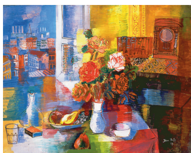
Jean Dufy, Assiette de fruits et bouquet de roses à l'atelier, 1927 - Huile sur toile - 73x92cm Collection privée - ©Adagp, Paris 2011